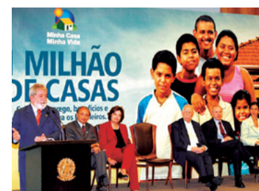
18 – MINHA CASA, MINHA VIDA (2009)