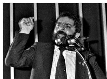
6 – DEPUTADO MAIS VOTADO NA ASSEMBLEIA CONSTITUINTE (1986)