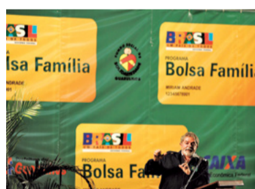
10 – CRIOU O BOLSA FAMÍLIA (2003)