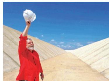
20 – INAUGURAÇÃO POPULAR DA INTERLIGAÇÃO DE BACIAS DO RIO SÃO FRANCISCO (2017)