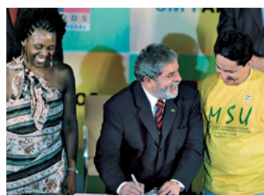
12 – PROUNI (2005)