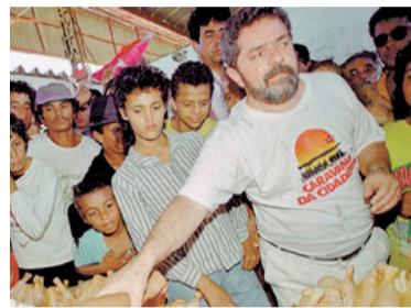
7 – 1ª CARAVANA DA CIDADANIA (1993)