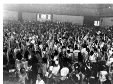
5 – FUNDOU A CUT (1983)