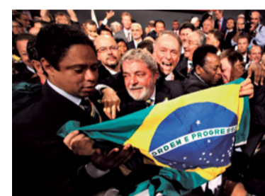
16 – SEDE DA COPA DO MUNDO 2014 E DAS OLIMPIADAS 2016