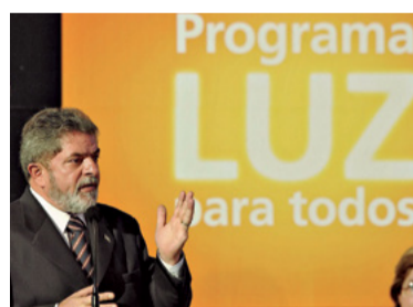
11 – LUZ PARA TODOS (2003)