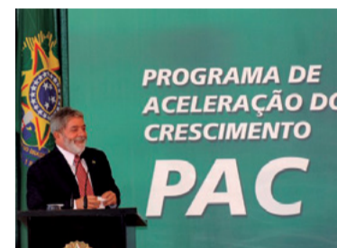
15 – LANÇOU O PAC (2007)