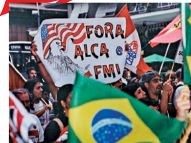
13 – QUITOU A DÍVIDA COM O FMI (2005)