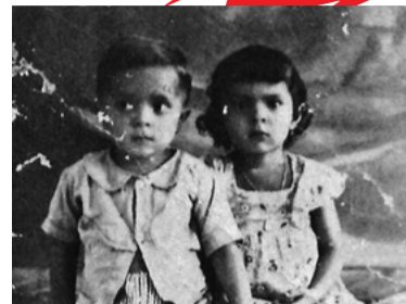
1 – SOBREVIVEU À FOME