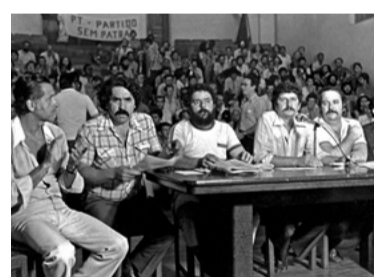
4 – FUNDOU O PT (1980)