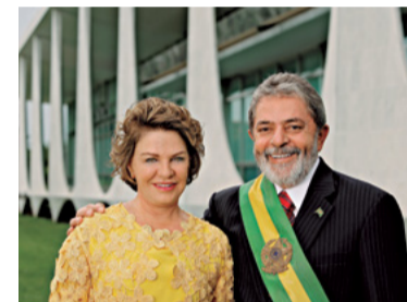
14 – REELEITO PRESIDENTE DA REPÚBLICA (2006)