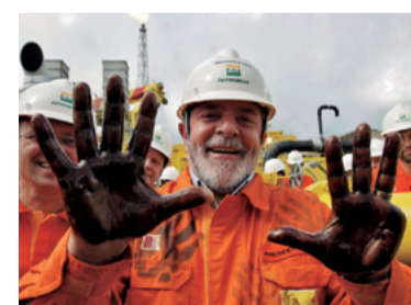
17 – DESCOBERTA DO PRÉ-SAL (2007)