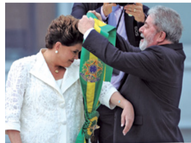
19 – ELEIÇÃO E REELEIÇÃO DE DILMA ROUSSEFF (2010 E 2014)