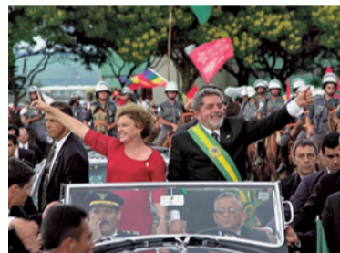
8 – ELEITO PRESIDENTE DA REPÚBLICA (2002)