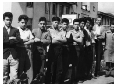
2 – FEZ SENAI E APRENDEU UMA PROFISSÃO (1960)