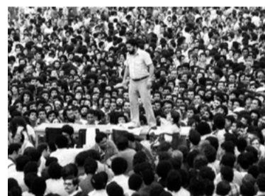
3 – ORGANIZOU A CLASSE TRABALHADORA (VILA EUCLIDES)