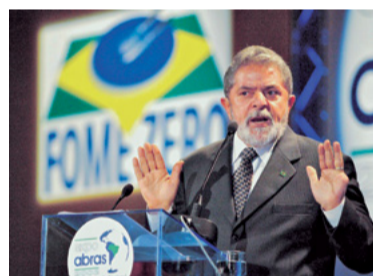
9 – LANÇOU O FOME ZERO (2003)